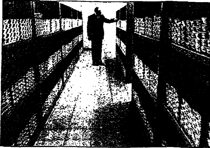
خزان أحد المصارف المركزية وملايين مكعبات على الرفوف .

ترتفع سعر الذهب ثم ينخفض ثم يستقر على رقم معين ربحا من الزمن ثم يعود الى الارتفاع ثم يهبط فحالة من يعود الى الاستقرار مؤقتا ، ثم ماذا ؟ قبلون هم الذين يستطيعون الاجابة على السؤال لكن الكثيرين صاروا يتعاطون مع الذهب من غير ان يطرحوا على انفسهم اية أسئلة ، خربت احوال الكثيرين في هذه التجارة لكن كثيرين آخرين صاروا موق السريخ ، السبب الاساسي في النجاح او الفشل عائد الى ما يسمى «المنهج» فسي نتطرق مع هذا المعدن الاصفر النادر .